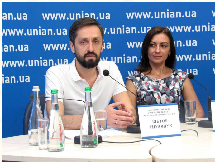
Прес-конференція «Два роки паспортної реформи: проблеми без вирішення?»

25 липня відбулася прес-конференція «Два роки паспортної реформи: проблеми без вирішення?». Експерти ЦППР підвели підсумки «паспортної реформи», яка почала впроваджуватися після прийняття Верховною Радою закону № 1474-VIII у липні 2016 року. Зокрема, сконцентрувалися на проблемах паспортної сфери, адже попереджали про їхнє настання ще до прийняття скандального закону. Утім, ініціатори прийняття цього акту – МВС та ДМС, – свого часу зауваження експертів проігнорували, як і народні депутати.